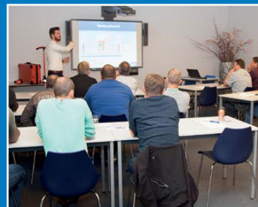
Séminaires et ateliers