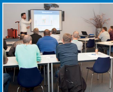
Seminars en workshops