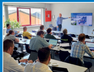
Trainingen en seminars